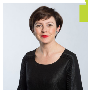
Carole Delga, présidente de la Région Occitanie / Pyrénées Méditerranée

Notre région est LA région de l'authenticité, de qualité et de l'innovation, des atouts majeurs pour le développement du secteur agricole et agroalimentaire qui est le 1er secteur économique d'Occitanie avec plus de 164 000 emplois et un chiffre d'affaires de 22 milliards d'euros. La Région est pleinement engagée pour agir au quotidien, concrètement, pour une agriculture innovante, diverse et durable.